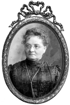
KIERUJĄCA KUCHNIĄ POLOWĄ